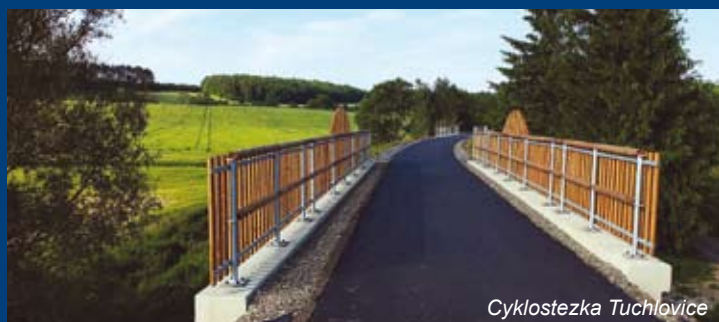
Příspěvky z rozpočtu SFDI na výstavbu a údržbu cyklistických stezek

SFDI poskytuje finanční prostředek na výstavbu a údržbu cyklistických stezek.